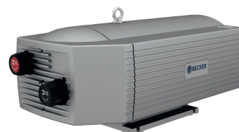
Combined: T and X