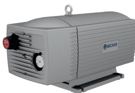
Vacuum: VT and VX