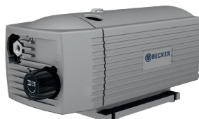
Pressure: DT and DX